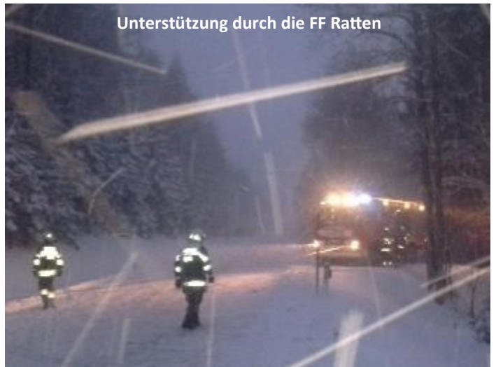
Unterstützung durch die FF Ratten