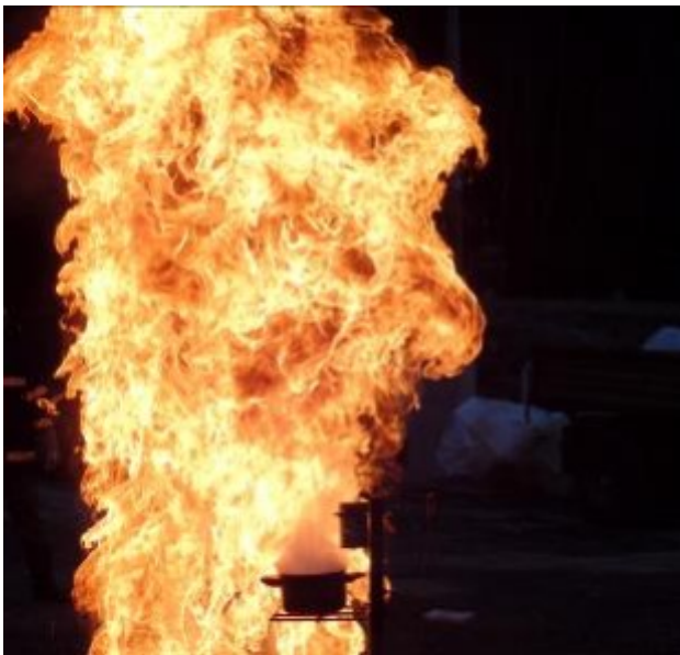
Gruppenübungen und Zugsübungen

Die Herbstübung wurde diesmal durch die Mehrwehrenübung in Falkenstein und die Räumungsübung bei der Volksschule ersetzt.