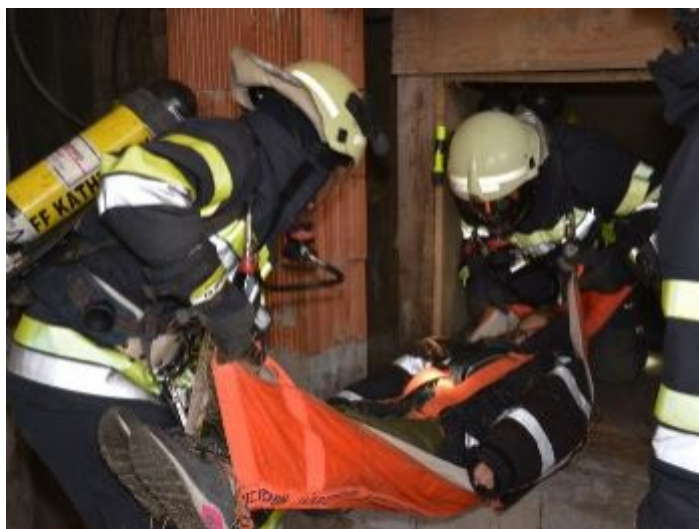
Volksschulräumungsübung am 23. Oktober