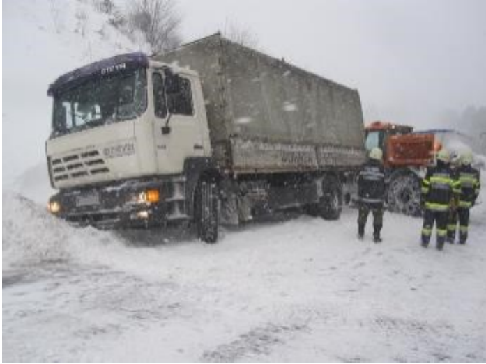
B72 Alpl Höhe Einfahrt Haubenwaller am 9. Februar