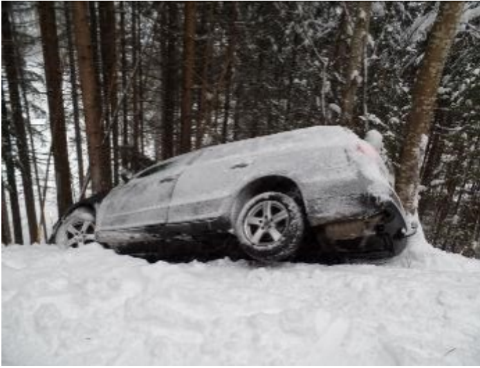
Höferbauerweg am 5. Jänner