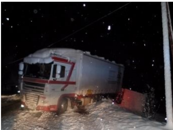
B72 Höhe Friedhof am 2. April