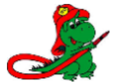
„Rigi“ mit voller Ausrüstung