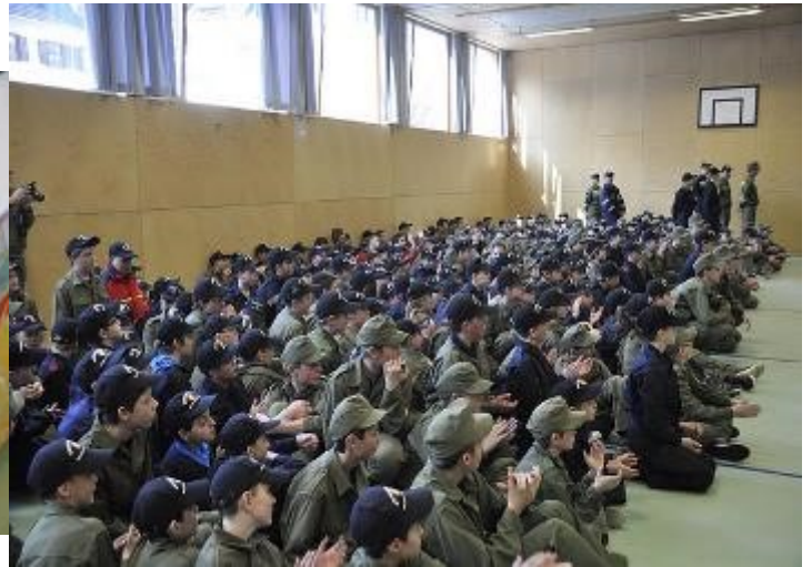
Mit rund 300 Jugendlichen war der Turnsaal zum Bersten voll