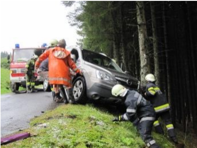
B72 Alpl Einfahrt Haubenwaller am 15. August