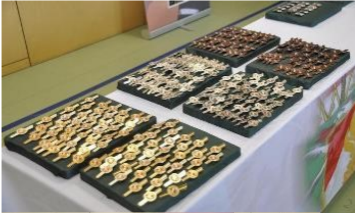
Die begehrten Medaillen

Wissenstest am 21. Februar in St. Kathrein a.H.