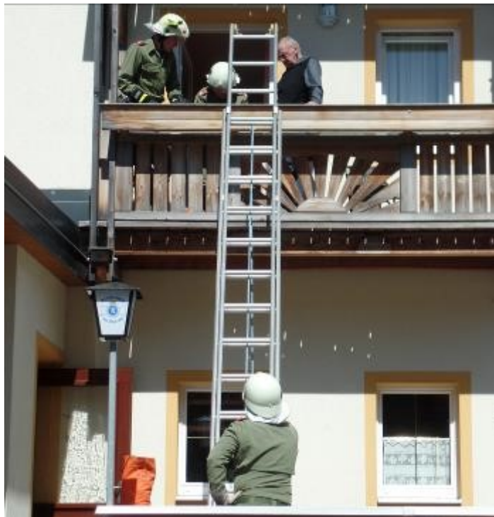
Mehrwehrenübung in Falkenstein am 17. Oktober